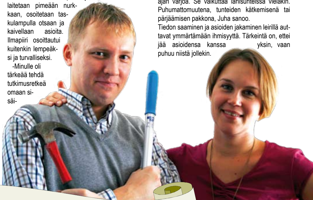
Teksti ja kuva: Sanna-Maria Tiisanen

-Minulle oli tärkeää tehdä tutkimusretkeä omaan sisä-